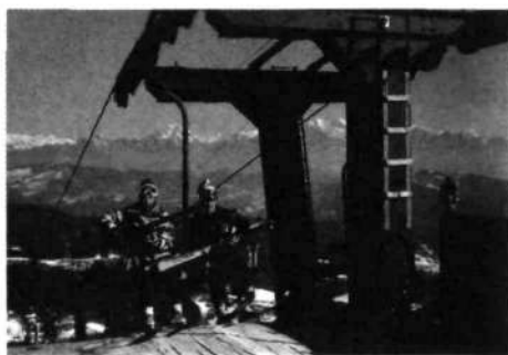
Sedežnica na Starem vrhu

Sledilo je več zelo slabih sezon. Snega ni bilo, center je malo deloval in DO Turist je pričela intenzivno delati na likvidaciji Starega vrha in prenosu žičnic na drug bolj uspešen teren. Tega pa Škofjeločani niso dopustili. Zahtevali so, da center ostane. S finančno pomočjo občine Škofja Loka (namenska sredstva 0,15 % od BOD za poslovanje in izgradnjo žičnic) in z vključitvijo TTKS (Temeljna telesno kulturna skupnost) Škofja Loka v organizacijo poslovanja, so bile ustvarjene razmere, da je center Stari vrh deloval še naprej.