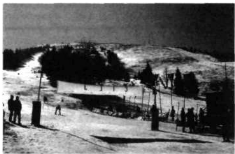
Smučarski tereni na Soriški planini